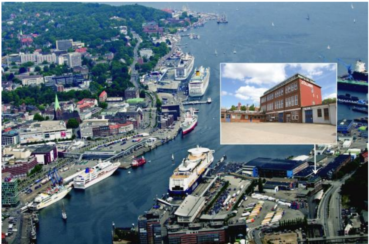
Luftbild des Norwegenkais

Des Weiteren hat der Norwegenkai einen hervorragenden Standort, aufgrund seiner Stadtnähe und der guten Infrastruktur.